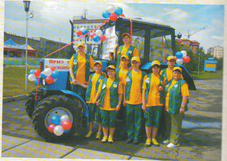
О движении ученических производственных бригад читайте в статье Е. А. Семеновй