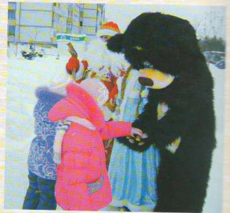
О театре «Кольцобинчик» читайте в статье И. Якшина