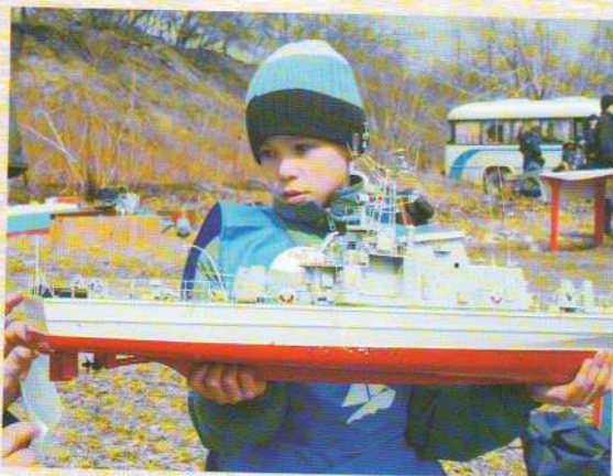
О развитии технического творчества ребят читайте в статье Н. Н. Дроновой